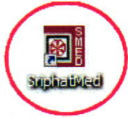
ภาพที่ ๒ การเข้าโปรแกรม SriPhatMed